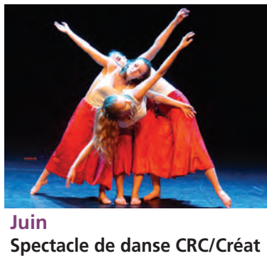
Juin Spectacle de danse CRC/Créat