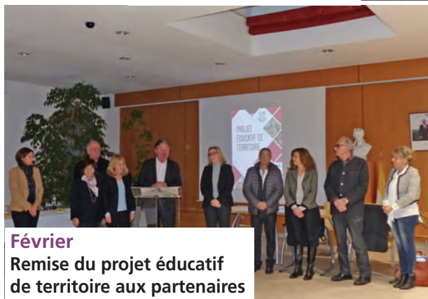
Février Remise du projet éducatif de territoire aux partenaires