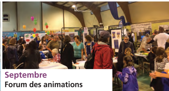
Septembre Forum des animations