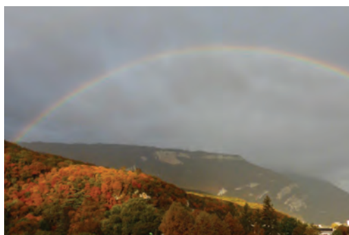
Arc-en-ciel sur les Vouillants, Nadine Schamp