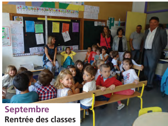
Septembre Rentrée des classes