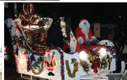
Décembre... S'écrit encore... Notez le 15 décembre, présentation du char puis passage dans les rues de la ville (voir page 7). Le 17, le Téléthon organisé par Acace... A découvrir au fil des pages de cette Gazette.