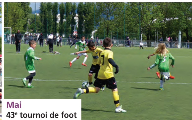
Mai 43 e tournoi de foot