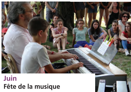
Juin Fête de la musique