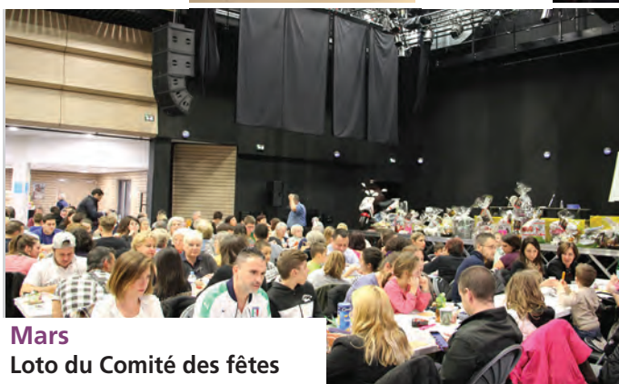
Mars Loto du Comité des fêtes