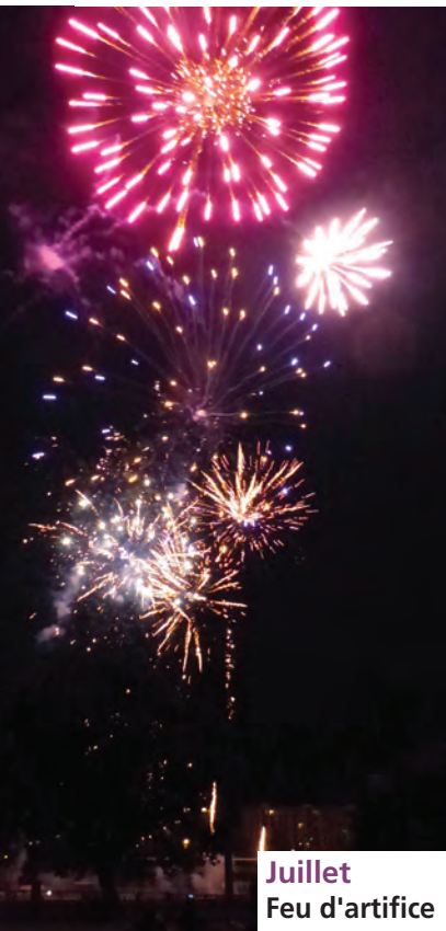
Juillet Feu d'artifice