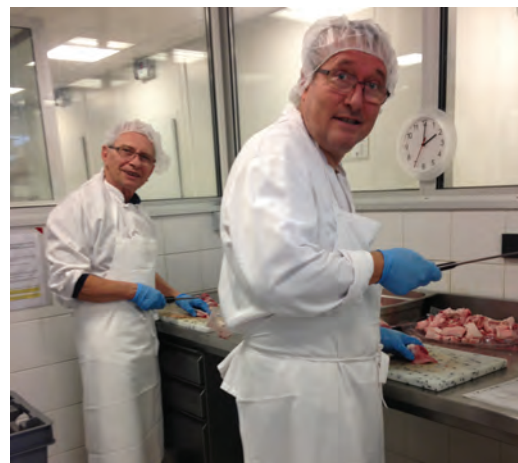
Cuisines des 3 étoiles solidaires, de la Banque alimentaire de l'Isère