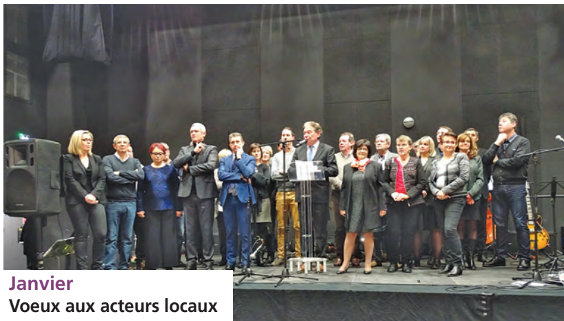
Janvier Voeux aux acteurs locaux