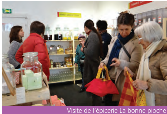
Visite de l'épicerie La bonne pioche

Visites, dégustations, rencontres et ateliers pratiques ont permis à chacun d'échanger trucs et astuces pour limiter le poids des déchets jetés chaque jour et de leur impact sur notre santé.