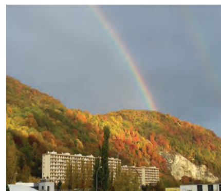
Belvédère aux couleurs de l'automne, Elodie Derunes