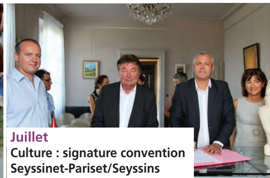
Juillet Culture : signature convention Seyssinet-Pariset/Seyssins