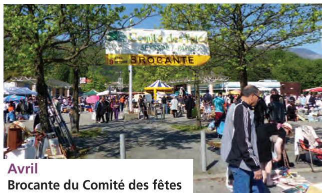
Avril Brocante du Comité des fêtes