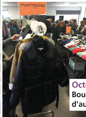
Octobre Bourse aux vêtements d'automne