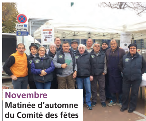
Novembre Matinée d'automne du Comité des fêtes