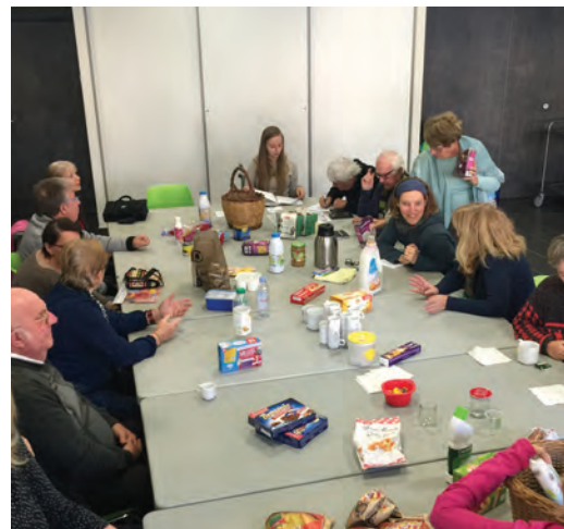
Echanges sur l'impact des emballages sur notre santé lors d'un thé-café