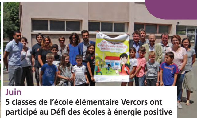
Juin 5 classes de l'école élémentaire Vercors ont participé au Défi des écoles à énergie positive