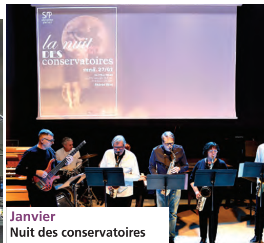
Janvier Nuit des conservatoires