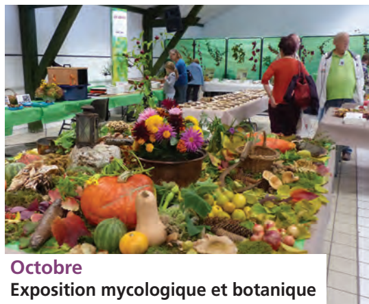
Octobre Exposition mycologique et botanique