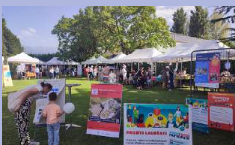
Le Forum des associations s'étend dans le parc de la piscine.