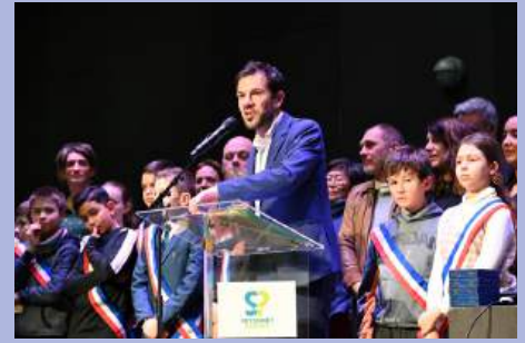
Vœux aux Seyssinettois et présentation de la nouvelle identité graphique de Seyssinet-Pariset.