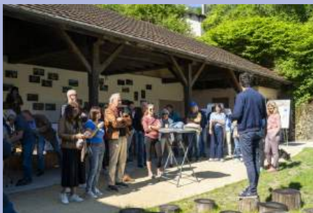
Rencontres de quartiers partout dans la ville. Ici, au village.