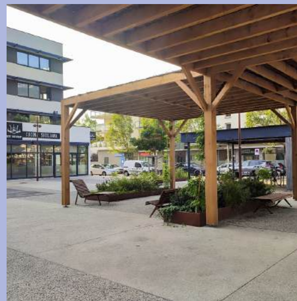
Îlot de fraîcheur. Installation d'une grande pergola, place Lucie Baud.