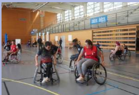
1er Forum du sport handicap au gymnase Aristide Bergés.