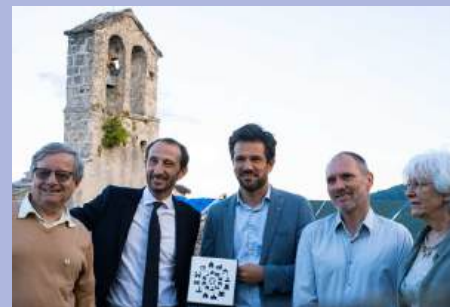
Lancement de la souscription pour rénover la Chapelle de Notre-Dame de Parizet, avec la Fondation du Patrimoine.