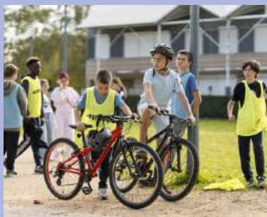
Les olympiades des jeunes avec la MSA.