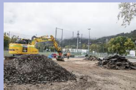
Lancement de la construction du Pumptrack.