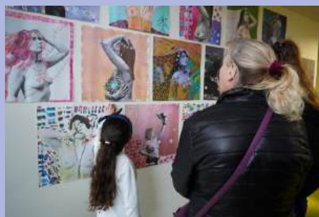
Octobre Rose : vernissage de l'exposition Vénus, à L'Arche.