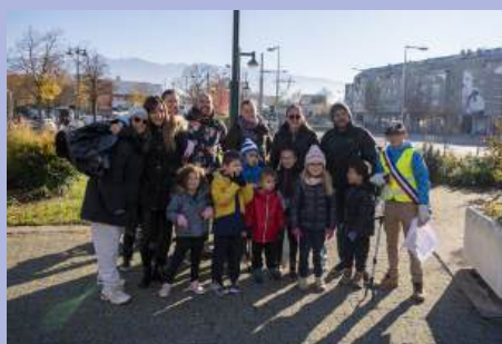
Seyssinet'toyage : « Du balai les incivilités ! » Les habitants mobilisés.