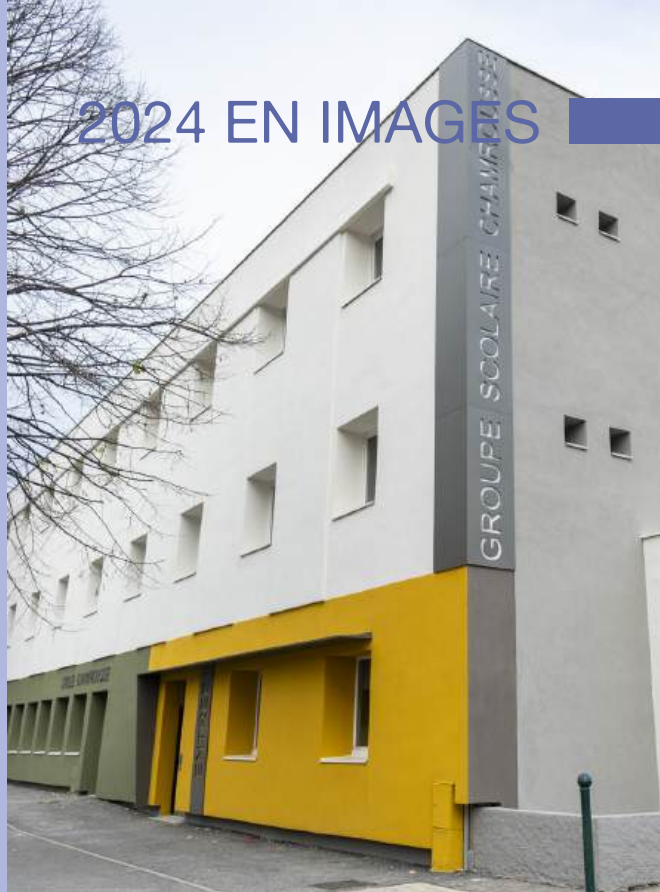
Rénovation thermique et amélioration de l'efficacité énergétique de l'école du groupe scolaire Chamrousse.