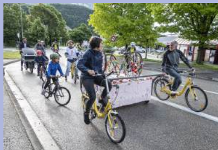
« Faites du vélo ! », un rendez-vous incontournable.