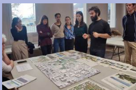
Le projet « Cœur de Ville » se concrétise.