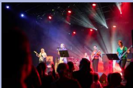
Fête de la musique à L'ilyade.