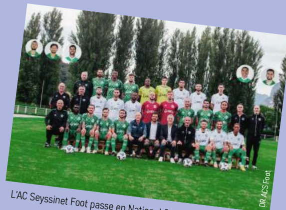
L'AC Seyssinet Foot passe en National 3 ! Allez les verts !