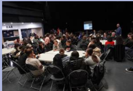
Cérémonie citoyenne et remise des cartes électorales aux jeunes majeurs.