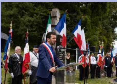
Mémoire Vivante : 80 ans de la tragédie des fusillés du Désert de l'Écureuil et inauguration de l'exposition permanente.