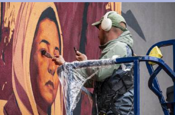
Dans le cadre du Grenoble Street Art Festival, les murs se transforment en œuvres.