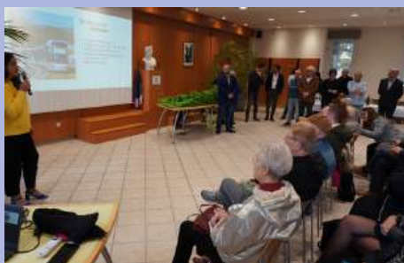
La Ville accueille ses nouveaux arrivants.