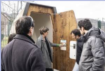
Inauguration des toilettes sèches au parc Lesdiguières, projet lauréat du budget participatif.