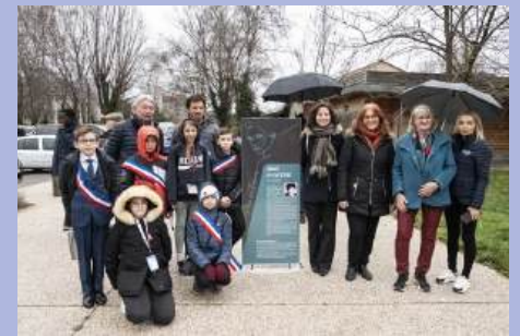
Place aux Femmes ! Dévoilement du totem « Anne Sylvestre » sur le parvis de l'Espace multi-accueil portant son nom.