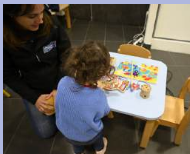
Le Relais Petite Enfance (ex RAM) fête ses 20 ans !