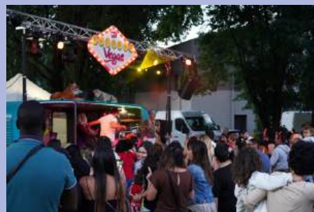
Seyssinet'stival, le rendez-vous de l'été.