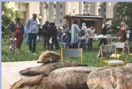
Roulotte des jeux, mare pédagogique, cendriers « Zéro mégots »... Le budget participatif, une réalité.