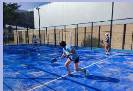
Terrains de Padel : aussitôt livrés, aussitôt testés !