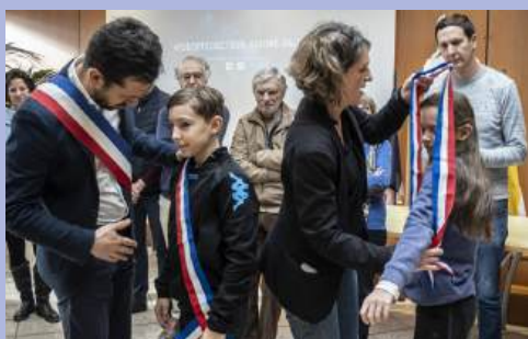
Installation du nouveau Conseil Municipal des Jeunes.