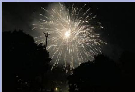
Feu d'artifices du 13 juillet dans le parc Lesdiguières.