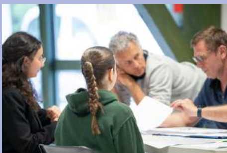
Jobs dating : 22 jeunes embauchés pour l'été.