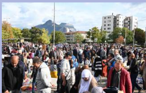
L'énorme brocante du Comité des fêtes.