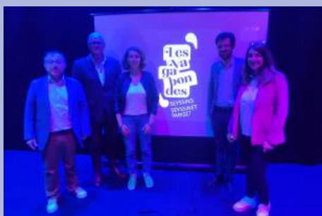
Dévoilement de l'identité et de la programmation culturelle « Les Vagabondes » Seyssins / Seyssinet-Pariset.