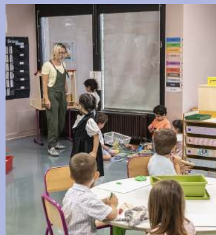
Une rentrée studieuse pour 891 enfants.