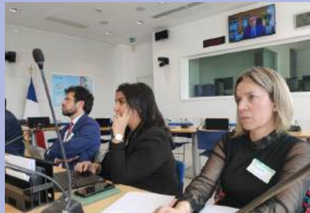
Invitation à l'Assemblée nationale pour présenter l'instauration du congés menstruel sur la commune.