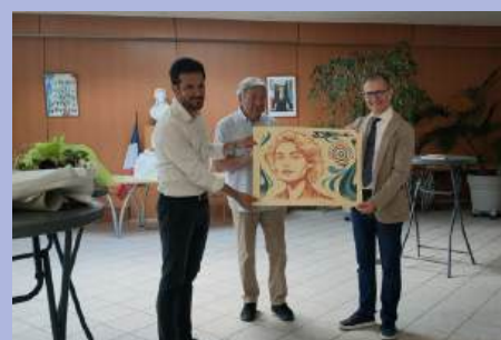
Le jumelage avec la ville italienne de San Giovanni Lupatoto est relancé.