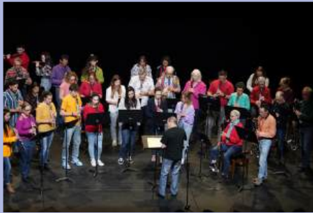
Le Conservatoire Musique et Danse fête ses 50 ans. Concert des retrouvailles, professeurs et élèves.

La Gazette vous propose un retour en images sur un échantillon de photos des chantiers, réalisations et événements - portés par les services municipaux et les associations - qui ont rythmé la vie de la commune et marqué l'année écoulée.