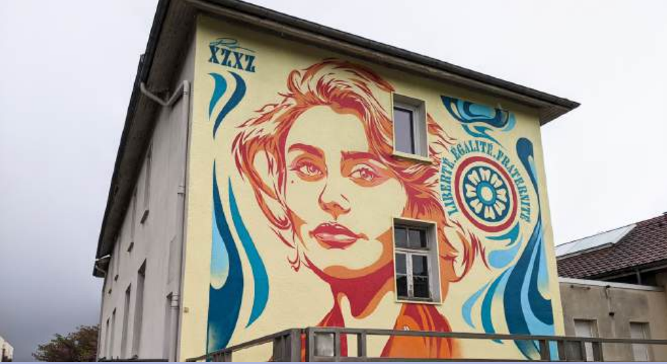
Inauguration de la fresque « Marianne » de Pierre XZXZ, dans le cadre des 80 ans du droit de vote des femmes.